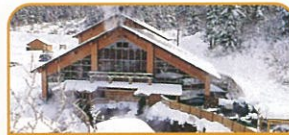
吹上温泉保養センター 白銀荘 TEL 0167-45-4126