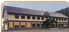
十勝岳温泉 カミホロ荘 TEL 0167-45-2970