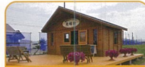
見晴台情報ステーション TEL 0167-45-4477