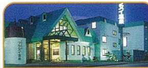
フロンティア フラヌイ温泉 TEL 0167-45-9779