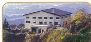
湯元 凌雲閣 TEL 0167-39-4111