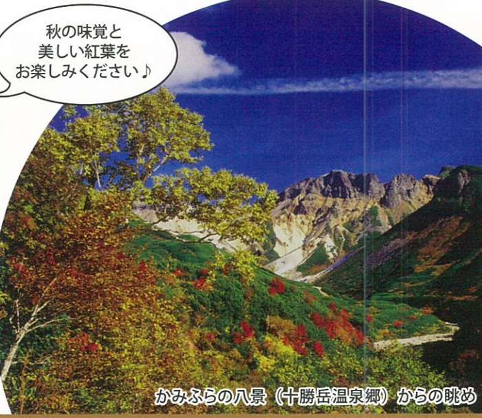
かみふらの八景 (十勝岳温泉郷) からの眺め