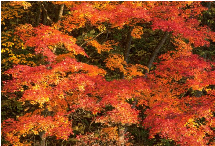
후라노 및 비에이 근교 가을 사진 *9 월 하순 - 10 월 하순,11 월 초순경까지